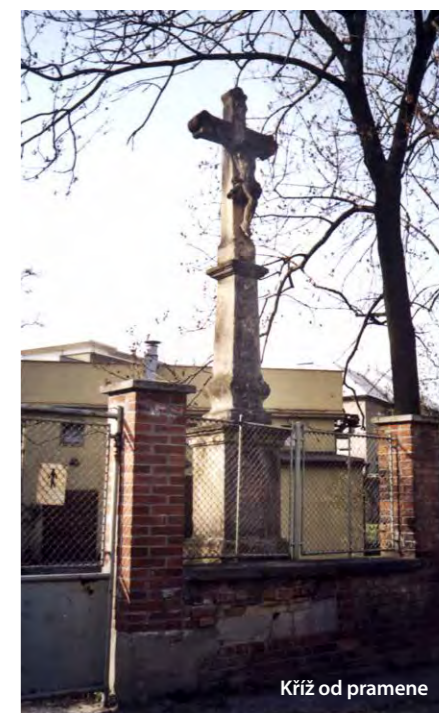
Kříž od pramene