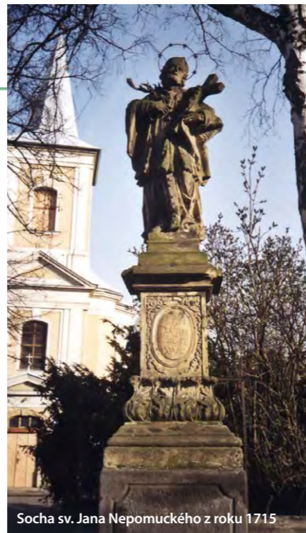
Socha sv. Jana Nepomuckého z roku 1715