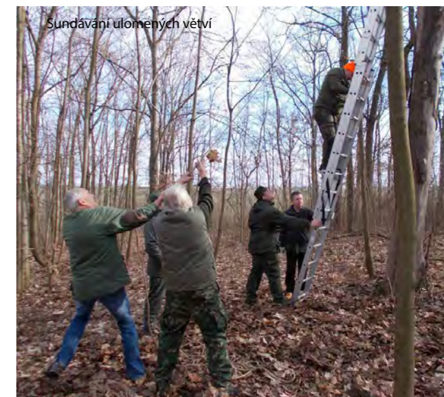
Sundávání ulomených větví