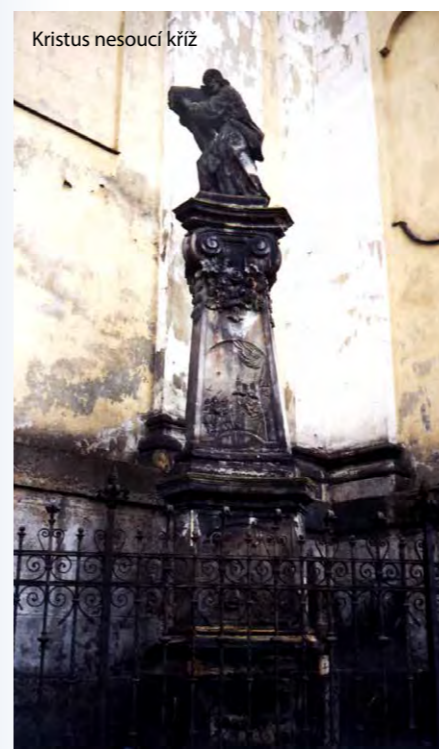
Kristus nesoucí kříž