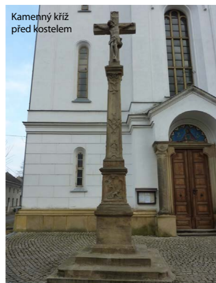
Kamenný kříž před kostelem

Zdále viditelnou památkou Smržic je farní kostel sv. Petra a Pavla na návsi. Původně tu byl gotický kostelík, který se v roce 1617 uvádí jako „velice spuštěný“. Jeho původní zasvěcení bylo archandělu Michaelovi. Kostelík byl poničený Švédy za třicetileté války. Dne 15. září 1765