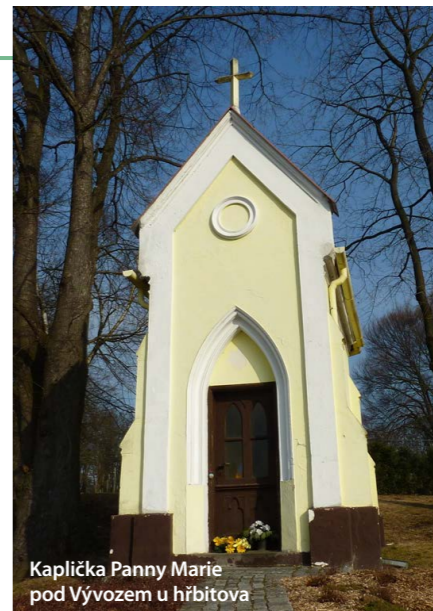
Kaplička Panny Marie pod Vývozem u hřbitova