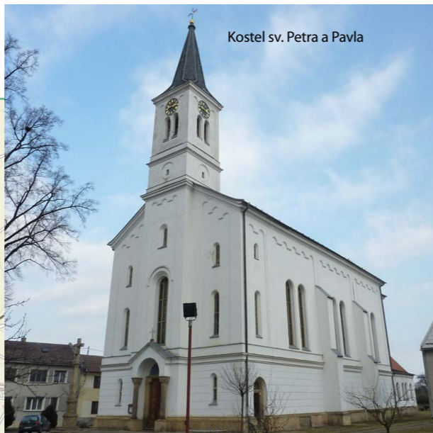
Kostel sv. Petra a Pavla