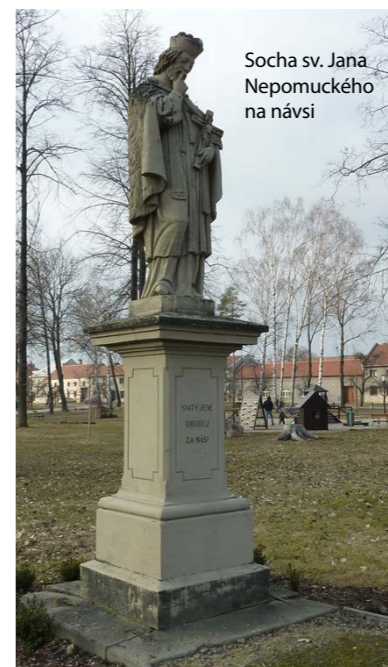
Socha sv. Jana Nepomuckého na návsi

Uprostřed křížovaty před Sokolovnou stojí kamenná sloupková čtyřhranná Boží muka. V kaplici jsou prázdné výklenky. Původně stála v místě, kde je dnes budova družstevní mlékárny. Pochází z počátku