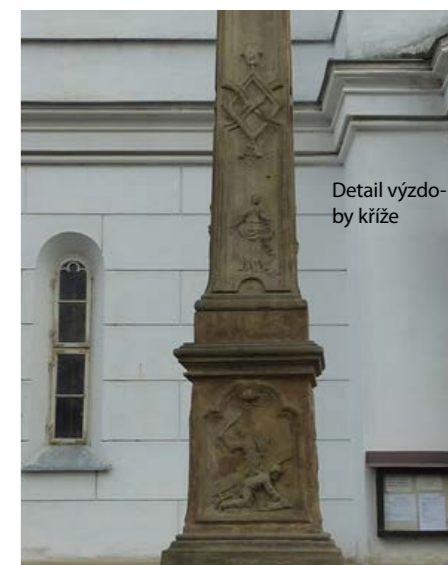
Detail výzdoby kříže

18. století a patří k nejstarším na okrese. Když ji přenášeli, našli pod ní v základech lidské kosti. Na novém místě byla zachycena a povalena nákladním autem v roce 1944.