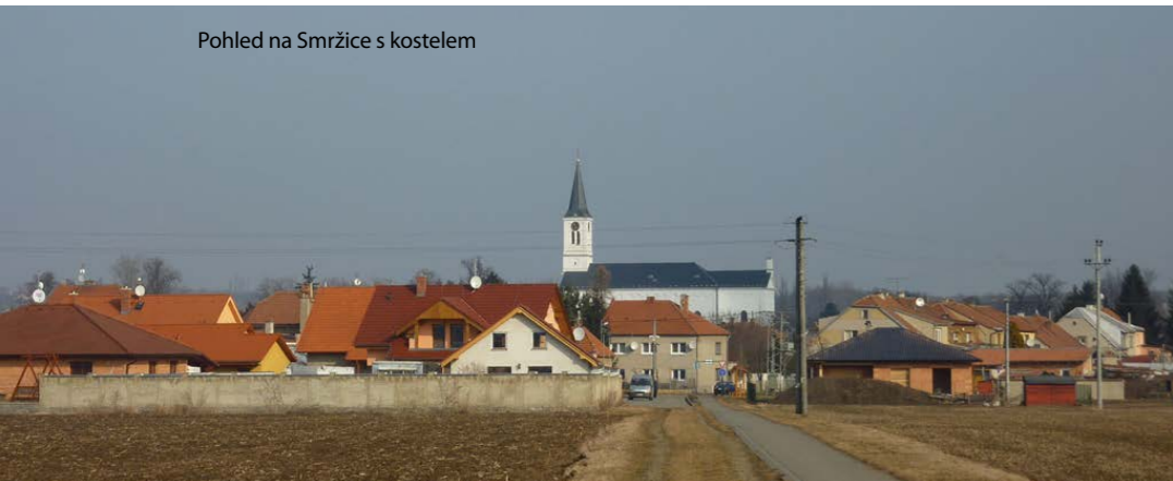
Pohled na Smržice s kostelem