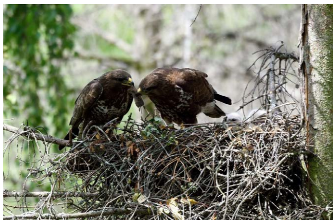
Káně lesní si předávají hraboše pro malá mláďata na hnízdě.

Poštolky, čápi, káně, sýčci a další predátoři hrabošů si mohou oddychnout, jed na hraboše se po polích sypat nebude. „Průběžné údaje ukazují, že situace není kritická a mohlo by se jí v letošním roce podařit zvládnout bez dalších mimořádných zásahů, např. v podobě povrchové aplikace rodenticidů. MZe by se k úvahám o této možnosti vrátilo pouze v případě, že by se kalamitní situace významně zhoršila,“ sděluje ministerstvo zemědělství.