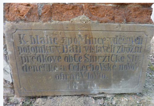
Kámen s nápisem ve zdi bývalého hřbitova