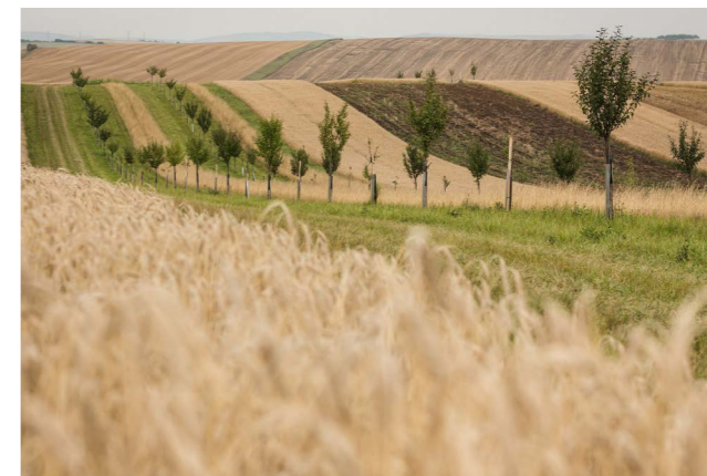
Krajina s menší výměrou polí, střídáním plodin a krajinnými prvky je atraktivní např. pro ptáky, kteří loví hraboše. Zároveň lépe odolá problémům, jako je eroze, sucho a přívalemé deště.

ků představovaly možné přístupy k řešení problematických gradací. I díky této odborné diskusi se jed po celé roky na povrch nesypal. „V roce 2026 se ale ohledně trávení hrabošů žádná jednání expertních skupin neodehrála. A zároveň je zářející, že ministerstvo životního prostředí nehrálo aktivnější roli a nevydalo žádné