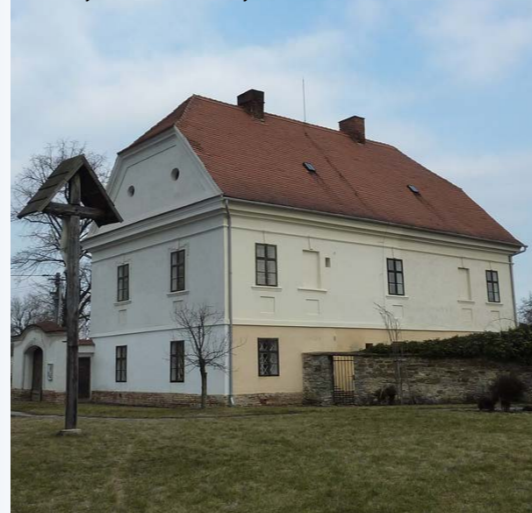
Dřevěný kříž a budova fary

shořela část vesnice i kostel, zbořen byl v roce 1854. Stavba nového kostela byla dokončena v roce 1861, kdy byl 26. října vysvěcen olomouckým světícím biskupem Rudolfem za velké účasti věřících. Kostelní věž je vysoká 46 m. Kolem kostela se do roku 1835 rozkládal starý hřbitov. Vedle kostela stojí cenná barokní stavba fary z roku 1761. Další hřbitov u silnice k Čelechovicím byl založen v roce 1835 a sloužil do roku 1915, kdy byl proměněn v louku. Dnes na něm stojí dva bytové domy. Kámen zasazený ve staré hřbitovní zdi má nápis: „K blahé upomínce vděčných potomkův dali vystavěti zbožní předkové obce Smržické, Studenecké a Čelechovické... 1. 5. 1875“. Do hřbitovní zdi byly vestavěné kapličky křížové cesty, z níž se dvě částečně zachovaly. Nový hřbitov ve svahu pod Stráží byl založen a vysvěcen v roce 1915.